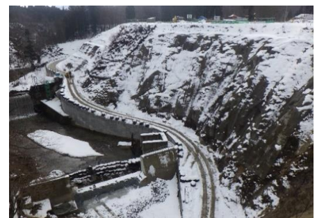
ダムサイト上流側の施工の様子 (H30.12.22)