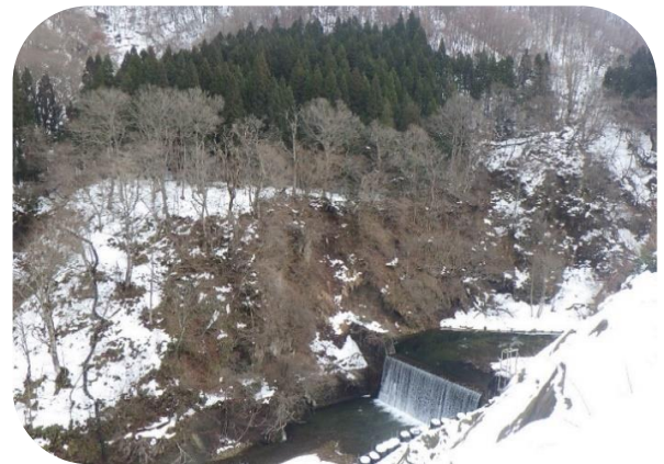
ダムサイト上流側の様子(H30.12.22)