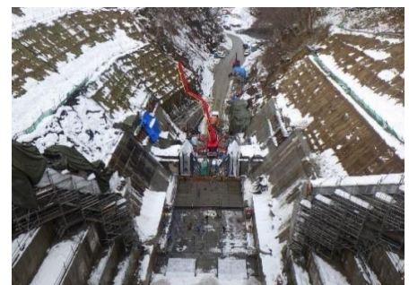
ダムサイト下流側の施工の様子 (H30.12.22)