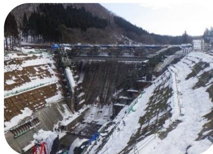
ダムサイト下流側からの様子(H30.12.22)

また、県道262号線は赤倉地区より先が冬期通行止めとなっております。現場のインフォメーションセンターと展望台もそれに合わせて撤去させていただきました。皆さまのご利用、ありがとうございました。来春に県道の開通に合わせて再度設置します。よろしくお願い致します。