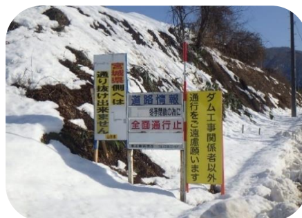
赤倉地区での通行止めの様子

発注者: 山形県最上総合支庁 施工者: 前田・飛島・大場JV 連絡先: 〒999-6105 山形県最上郡最上町大字富澤 字菅ノ平3780-1 TEL 0233-46-3430 FAX 0233-46-3431 ホームページ http://mogamiogunigawa-jv.jp/