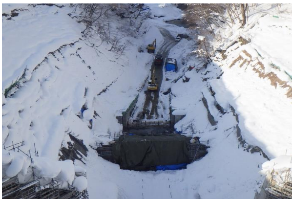
ダムサイト下流：減勢工副ダム工(H31.1.22)

現在は、上流では上流2次仮締切の改良工事、下流では減勢工副ダム工を行っています。