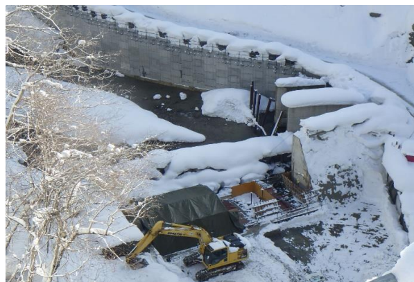
ダムサイト上流：上流2次締切改良工(H31.1.22)