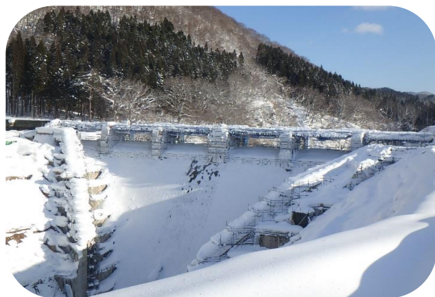
雪化粧のダムサイト(H31.1.22)