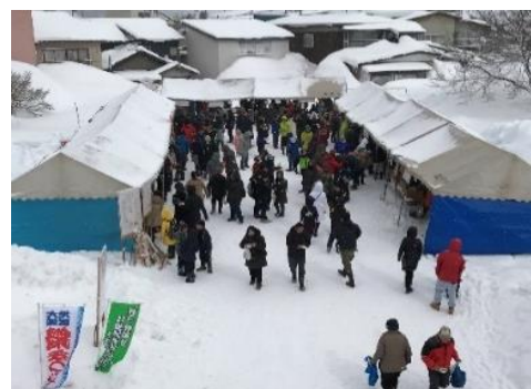
↑昨年開催時の様子

発注者: 山形県最上総合支庁 施工者: 前田・飛島・大場JV 連絡先: 〒999-6105 山形県最上郡最上町大字富澤 字菅ノ平3780-1 TEL 0233-46-3430 FAX 0233-46-3431 ホームページ http://mogamiogunigawa-jv.jp/