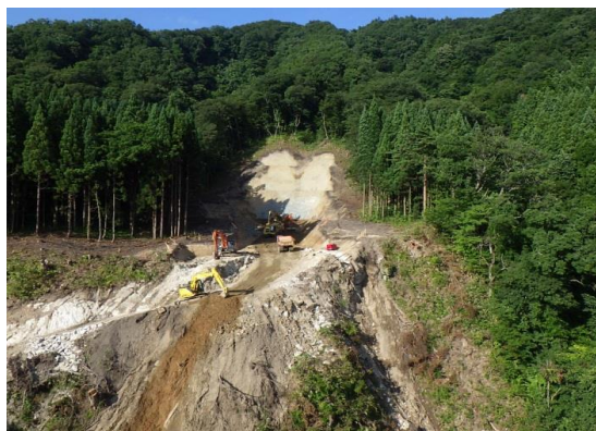
写真：右岸側基礎掘削状況

左岸天端のヤードにおきましては、ダムコンクリート製造のための仮設備の設置工事を行っております。設備につきましてもかなり全容が見えてきました。