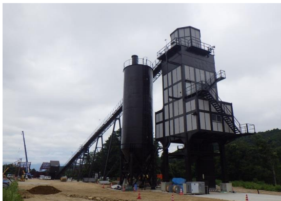
写真：コンクリート製造設備側から骨材貯蔵設備側を望む