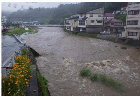
増水した最上小国川

7月6日(水)は梅雨前線の影響で東北地方で大雨となり、山形県の最上地方などに大雨警報が発表され、強い雨が降りました。最上小国川の水位も上昇し、赤倉地区では側溝が冠水するなどしました。当作業所は最上町との災害協定に基づき、ポンプでの排水作業を行いました。