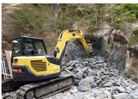
呑口部掘削(平成27年7月)