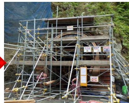
コンクリート工完了(平成27年9月)