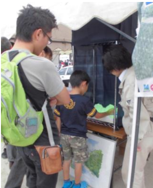
プロジェクションマッピング