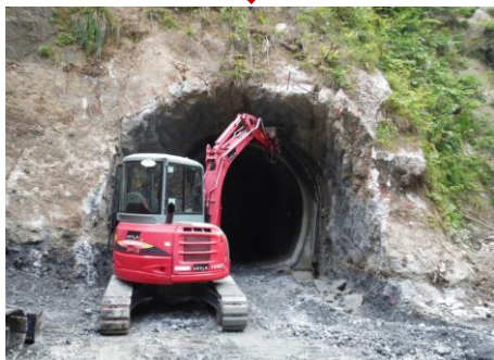
トンネル部掘削(平成27年8月)

9/10~11日の豪雨により工事用道路の一部が壊れましたが、早期に復旧して工事を進めて参ります。