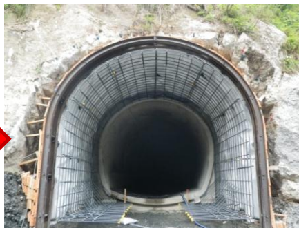
止水・鉄筋工(平成27年8月)