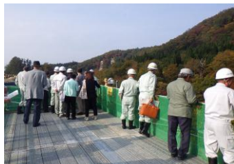
〈小国川漁業協同組合〉

10月19日に小国川漁業協同組合の皆さん、山形県議会議員の皆さん、10月21日に東北ダム促進連絡協議会の皆さんが現場見学にいらっしゃいました。