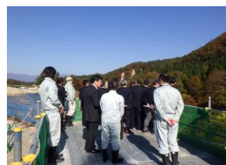
〈東北ダム促進連絡協議会〉