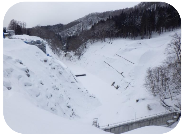
現在のダムサイト

全国的にもインフルエンザが流行しているようです。まだまだ寒さも厳しいですので、体調を崩されませんようお気を付け下さい。