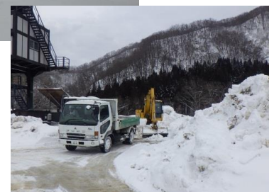
場内の除雪の様子