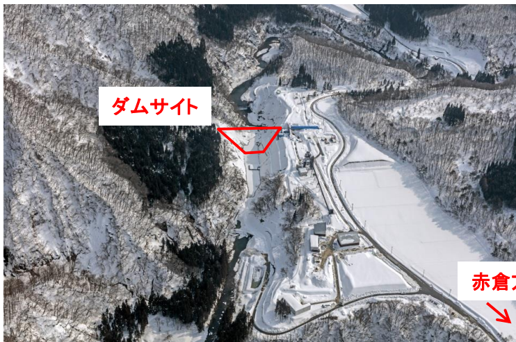
航空写真による工事区域全景